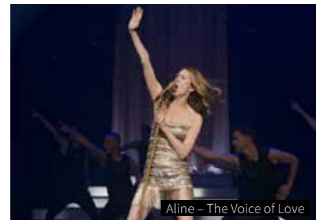
Aline – The Voice of Love