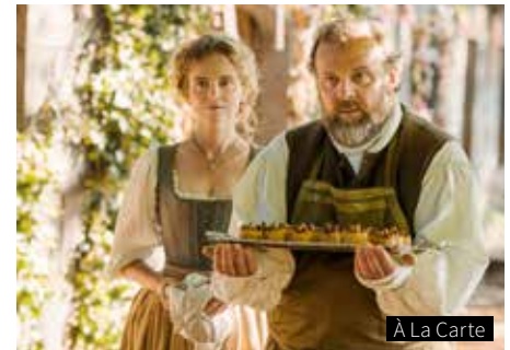
A La Carte

Ausschreibung der Stadt gewinnt. Sie darf den historischen Vorplatz von Notre-Dame neu gestalten. Ob es ihr gelingt, zwischen Presserummel, liebestollen Männern und der exzentrischen Oberbürgermeisterin die Nerven zu behalten?