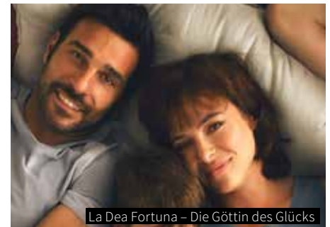
La Dea Fortuna – Die Göttin des Glücks