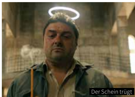
Der Schein trügt