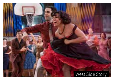
West Side Story