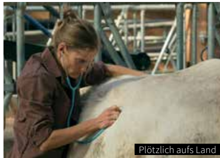
Plötzlich aufs Land