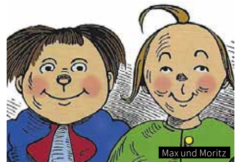
Max und Moritz