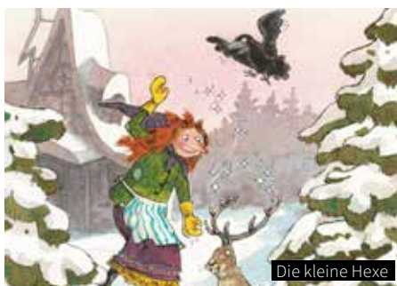
Die kleine Hexe

xer und nun auch Schauspieler. Ein Mensch mit vielen Facetten, dessen Porträt Jannis Lenz mit ausreichend Raum gezeichnet hat. Es vermag Ahmets Stärke und Vehemenz, aber auch seine Zartheit und seinen Humor zu fassen. Nach und nach gibt sich jemand preis, ohne blankzuziehen.