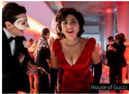
House of Gucci