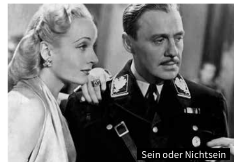
Sein oder Nichtsein