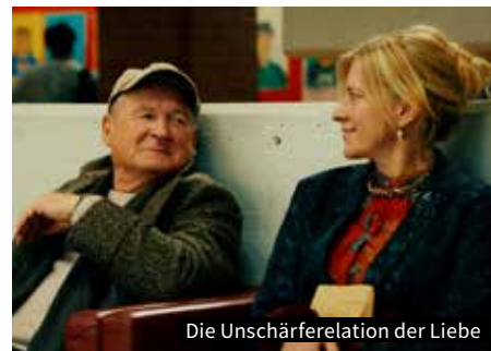
Die Unschärferelation der Liebe