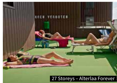
27 Storeys – Alterlaa Forever