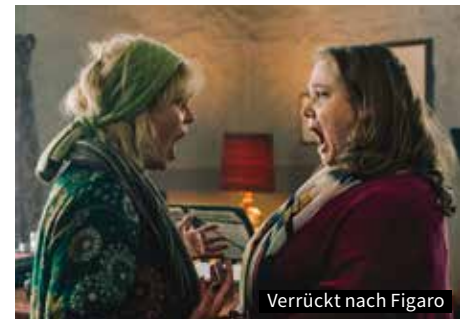
Verrückt nach Figaro