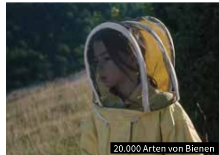
20.000 Arten von Bienen