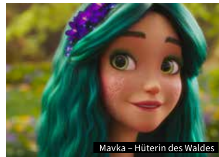
Mavka – Hüterin des Waldes

Bastien und Chloé verbringen ihre Sommerferien mit ihren Familien in einer Hütte an einem See in Quebec, die von einer Geisterlegende heimgesucht wird. Trotz des Altersunterschieds entsteht ein einzigartiges Band zwischen ihnen. Bastien ist bereit, seine schlimmsten Ängste zu überwinden, um einen Platz in Chloés Herz zu erobern.