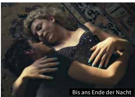
Bis ans Ende der Nacht