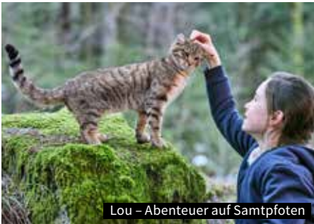
Lou – Abenteuer auf Samtpfoten