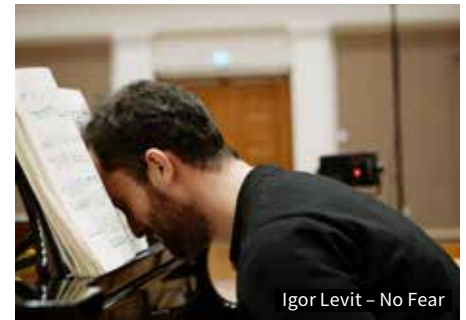
Igor Levit – No Fear