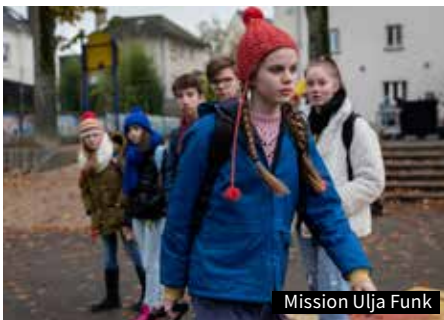
Mission Ulja Funk