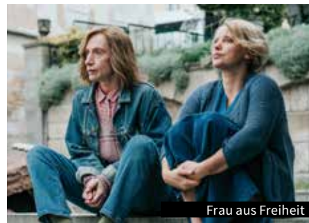
Frau aus Freiheit

Der Film feierte im Wettbewerb der 77. Filmfestspiele von Cannes seine Weltpremiere und ist hochkarätig besetzt mit dem für einen Emmy® nominierten Sebastian Stan (Pam & Tommy) als Donald Trump, dem Emmy®-Preisträger Jeremy Strong (Succession) als Roy Cohn und der Oscar® nominierten Maria Bakalova (Borat Subsequent Moviefilm) als Trumps erster Ehefrau Ivana.