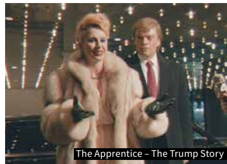
The Apprentice – The Trump Story