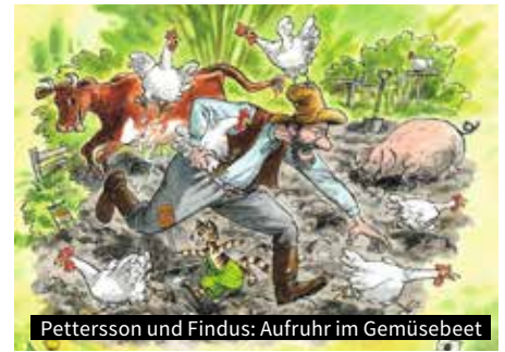
Pettersson und Findus: Aufruhr im Gemüsebeet

Helene, eine einst gefeierte Theaterdiva, lebt zurückgezogen in der Seniorenresidenz, in der sich die ehemalige Pflegerin und Frührentnerin Toni von einem Sturz erholen muss. Beide könnten unterschiedlicher nicht sein. Helene begegnet ihren Ängsten mit Allüren und Kontrollwahn, während Toni Probleme mit Witzen überspielt oder mit Schnaps hinunterspült. Gemeinsam treten sie eine Reise zur Sterbehilfe in die Schweiz an. Ein fehlender Führerschein ist dabei das kleinste Hindernis, das sich den alten Frauen in den Weg stellt: Denn Helenes Neffe, ein konservativer Politiker, sieht seine Karriere durch Helenes Pläne gefährdet und stellt den beiden nach. Ein tragikomisches Roadmovie, in dem