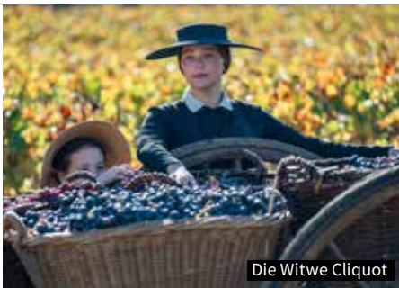
Die Witwe Clicquot