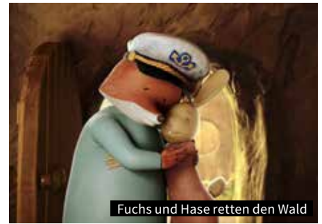
Fuchs und Hase retten den Wald