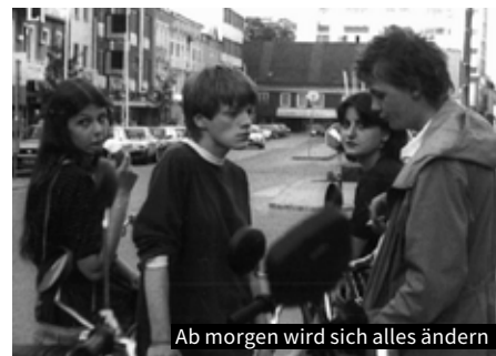
Ab morgen wird sich alles ändern

„Ein optisch und im Dialog hingetupfter Welser Kleinstadtnachmittag. Mir persönlichen schienen diese G'schichten aus Wels als der bedeutendste Beitrag überhaupt zu sein, weil er vermag, was dem deutschsprachigen Film bisher überhaupt versagt ist, zarte Pointen zu setzen.“ Fritz Walden, ARBEITERZEITUNG